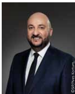
Étienne Schneider Vizepremierminister Minister für Gesundheit