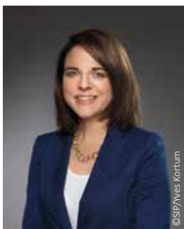
Corinne CAHEN Ministerin für Familie und Integration Ministerin für die Großregion

Diese Broschüre wird vor allem an medizinische Fachkräfte sowie an Pflege- und Betreuungseinrichtungen verteilt und wird auf den Internetseiten unserer Ministerien elektronisch verfügbar sein.